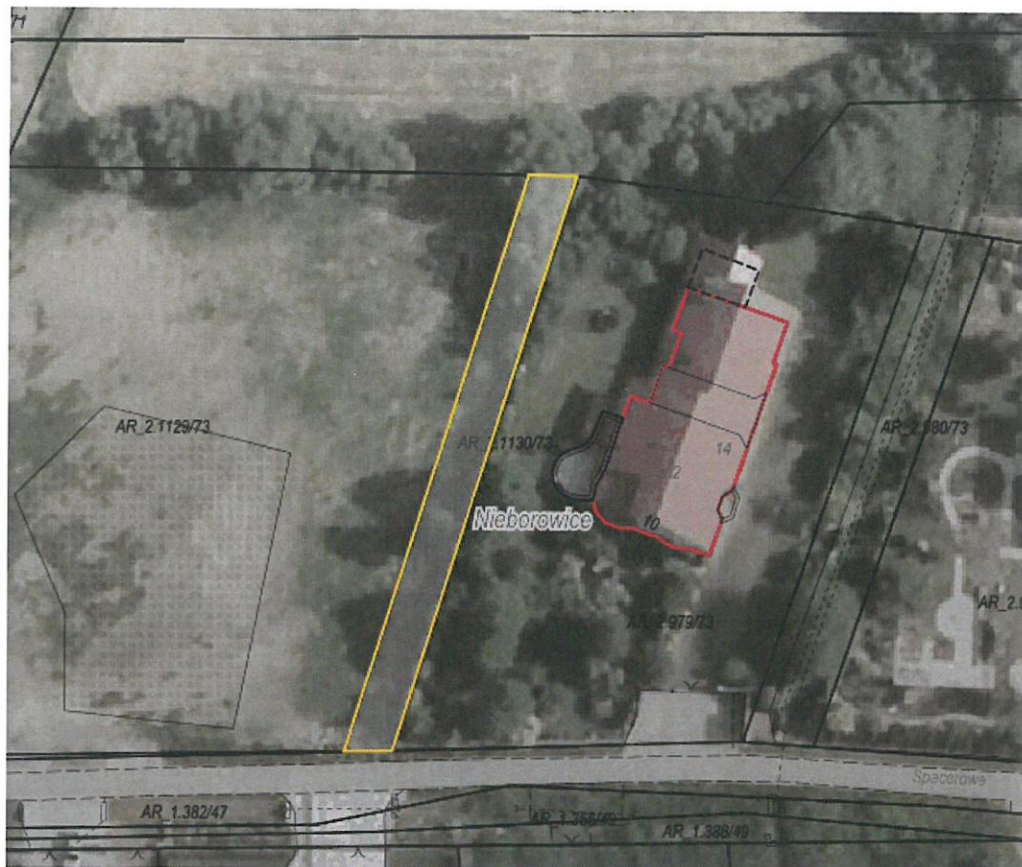
Rysunek 1 Działka przeznaczona do sprzedaży zaznaczona kolorem żółtym